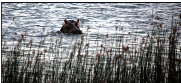
Lake Sibaya huser RIGTIG mange flodheste

Verdens klasse dykning, spektakulær snorkling. Udflugter til den nærliggende Lake Sibaya. Dybhavs fiskeri arrangeres gerne (ud fra Sodwana Bay, ca. 1½ times kørsel). Følg med til stranden og vær vidne til, når de store arter af havskildpadder kravler op fra havet og lægger deres æg på stranden.